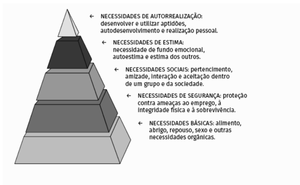
Figura 1 - Pirâmide de Maslow

Pode-se observar que na figura 1 as necessidades representadas pelos níveis da pirâmide indicam cada etapa que uma pessoa deve satisfazer para poder avançar para níveis mais elevados da pirâmide.