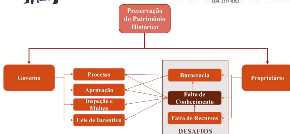
Figura 3. Mapa dinâmico para preservação do patrimônio histórico de São Paulo.