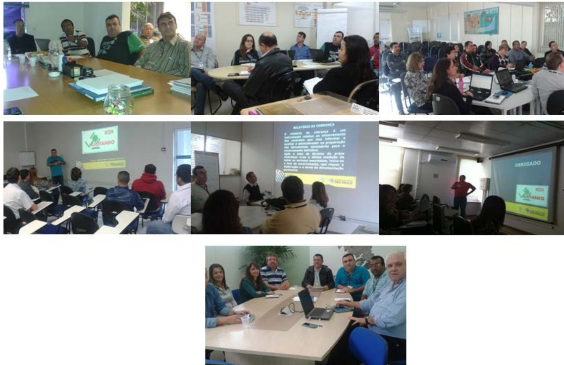
Figura 1: Reunião na áreas

EM 2016 as ações da prática foram ampliadas, visando sempre ter uma visão bastante clara, ampla e substancial de potenciais melhorias nos processos, proporcionados pelo espírito colaborativo e a objetividade nos trabalhos. Entre as atividades planejadas foram desenvolvidas: