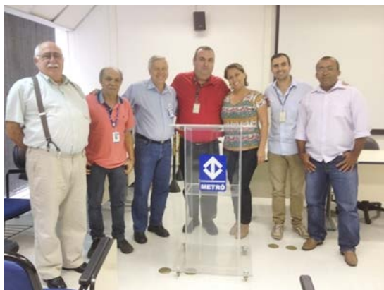
Figura 2 – Benchmark no Metro

Benchmark em área de Licitação Externa (Metrô)