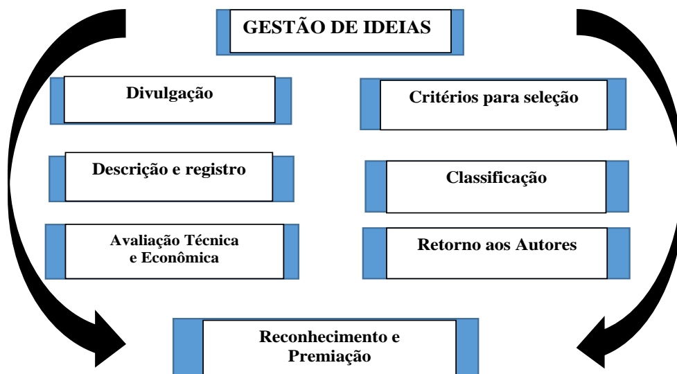
Gestão de Ideias da Lar