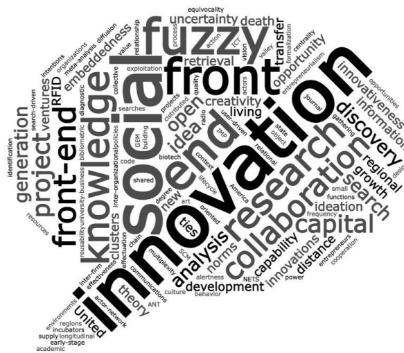
Figura 3. Palavra-chave a partir dos artigos selecionados

A Figura 4 demonstra as palavras-chave mais utilizadas nos artigos do portfólio analisado. O destaque são as palavras “ innovation ”, “ social ”, “ fuzzy front end ”, “ knowledge ”, “ collaboration ” e “ research ”, conforme representado na nuvem de palavras a seguir.