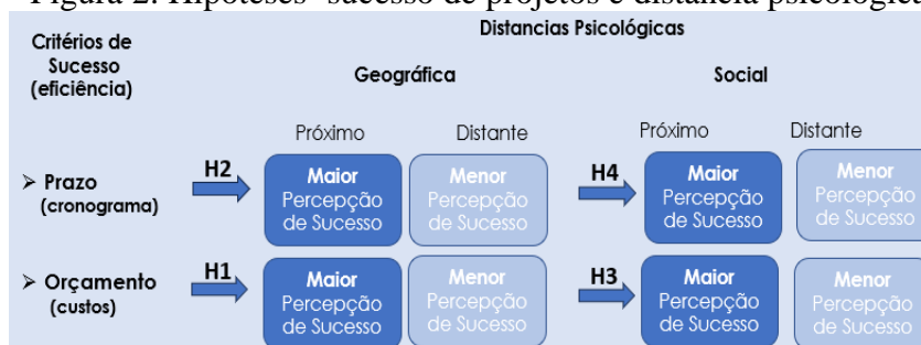
Figura 2: Hipóteses -sucesso de projetos e distância psicológica

O modelo representado na figura 2 explicita as hipóteses acima.