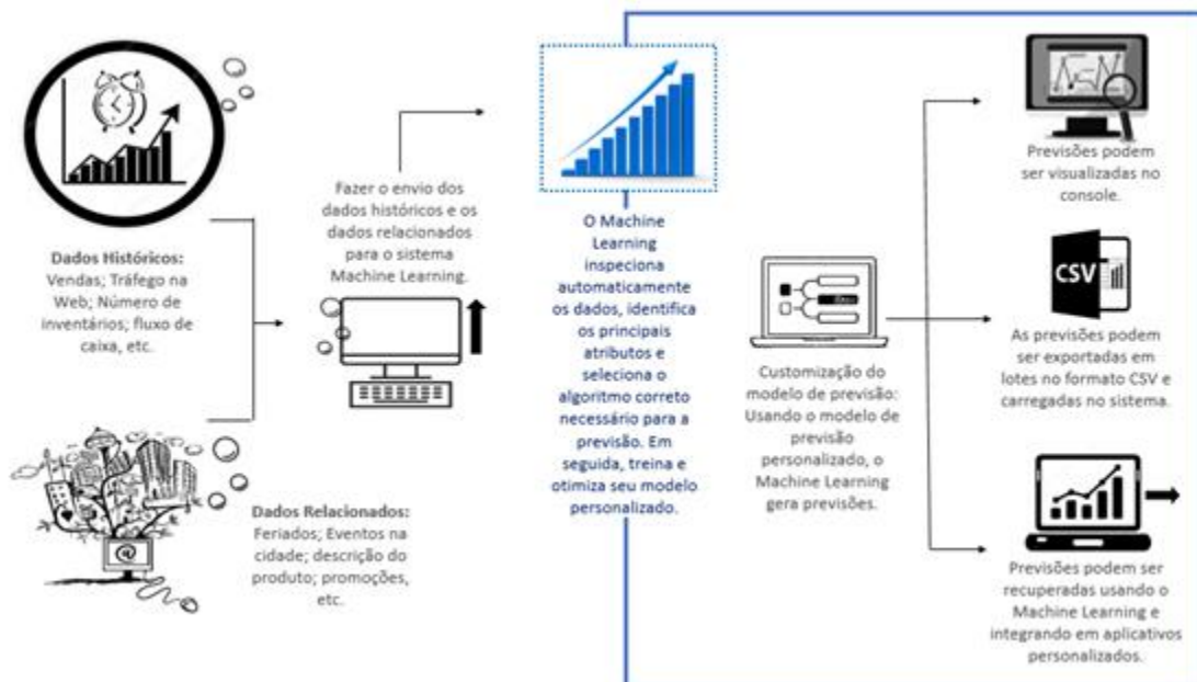
Figura 4: Funcionamento do Machine Learning

Com a utilização de duas ferramentas da indústria 4.0, o Machine Learning e o Big Data, torna-se possível realizar uma previsão de demanda mais assertiva, com base em uma combinação de dados de séries temporais com variáveis adicionais que se possam afetar as previsões. Por exemplo a demanda por um determinado modelo de blusa pode mudar com as estações da cadeia de suprimentos e até o cliente final. Esse tipo de análise pode se tornar complexo e difícil de ser determinado sozinho, porém com a ajuda do Machine Learning, torna-se possível reconhecê-lo, pois após ser fornecido os dados históricos e possíveis interferências na análise, a ferramenta examinará automaticamente o que realmente é necessário e produzirá um modelo capaz de realizar a previsão de demanda, sendo mais precisa do que apenas realizar as análises históricas. A figura 3 representa o funcionamento da ferramenta Machine Learning para realizar previsão de demanda.