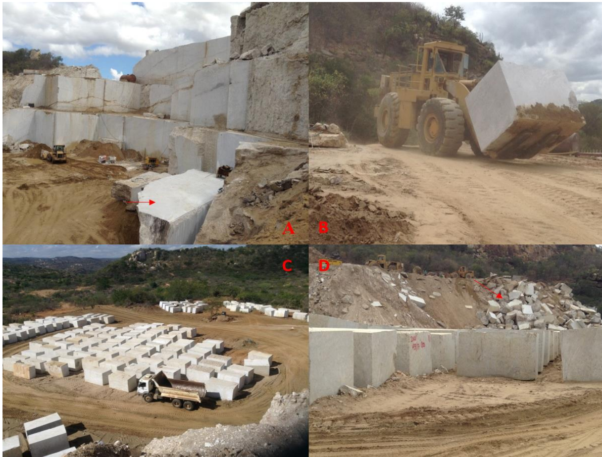
Figura 4. Desmonte - A = Prancha tombada; B = Transporte do bloco para o pátio de estocagem; C = Pátio de estocagem, D = Deposição de rejeitos

A pedreira no Sítio Mufumbo emprega 40 funcionários e gera cerca 80 empregos indiretos na região, possui licença ambiental do órgão fiscalizador competente IDEMA, a empresa funciona 24h por dia em dois turnos de 12h. dispõem de alojamento para os funcionários com cozinha, refeitório, área para descanso e convivência.