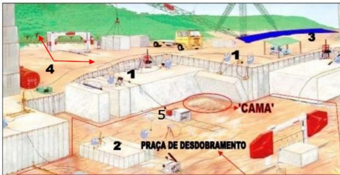
Figura 3. Ilustração de uma frente de lavra de rocha ornamental, em maciço, utilizando fio diamantado

Para a operacionalização da lavra, há uma intervenção significativa no ambiente, com desmatamento e decapeamento do estéril, limpeza e terraplanagem das áreas de servidão, construções de acessos, área de estocagem e transporte de blocos, pátio de manobra, área de depósito de rejeitos, conforme pode ser observado mostrado na Figura 3, onde 1= corte primário para desabamento de fatias maiores, 2= esquadrejamento em corte secundário, 3= vias de transporte dos blocos, 4= desmatamento, decapeamento de estéril e 5= Máquina de corte a fio diamantado, (OLIVEIRA 2006).