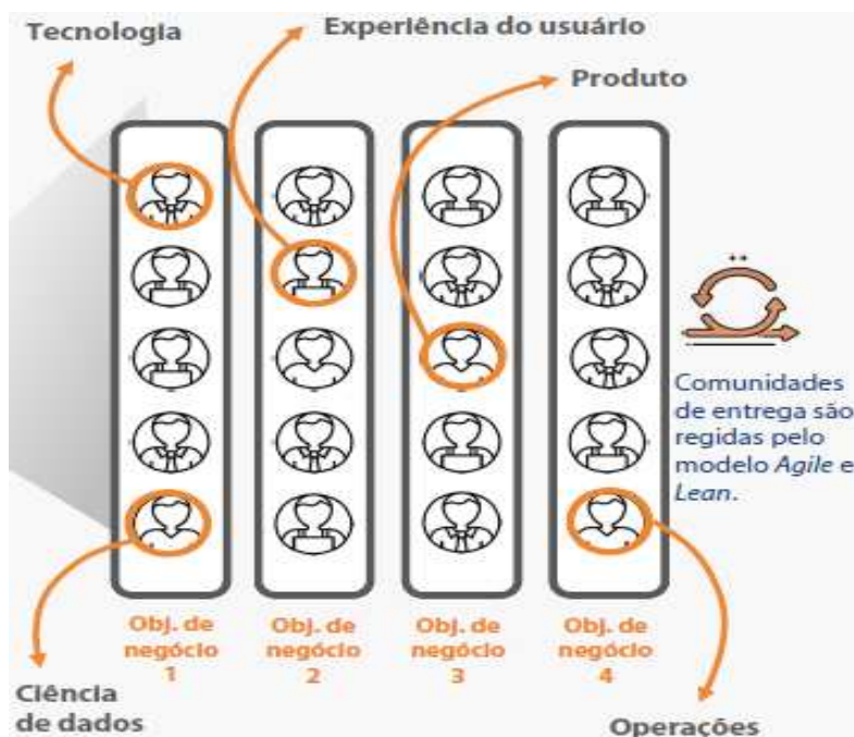
Figura 2 – Modelo de trabalho das Comunidades de Entrega

A Figura 2, abaixo, mostra o modelo de trabalho das Comunidades de Entrega, com pessoas de diversas áreas e formações para pensar em soluções focadas no cliente; seguindo com rigor metodológico a aplicação de Framework Ágil e Lean na resolução dos desafios, fornecendo mais autonomia e gerando maior colaboração dentro dos times.