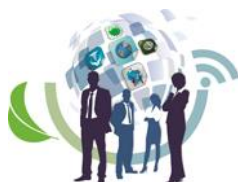
Figura 3 – Ampliação da velocidade de oferta digital do Itaú Unibanco