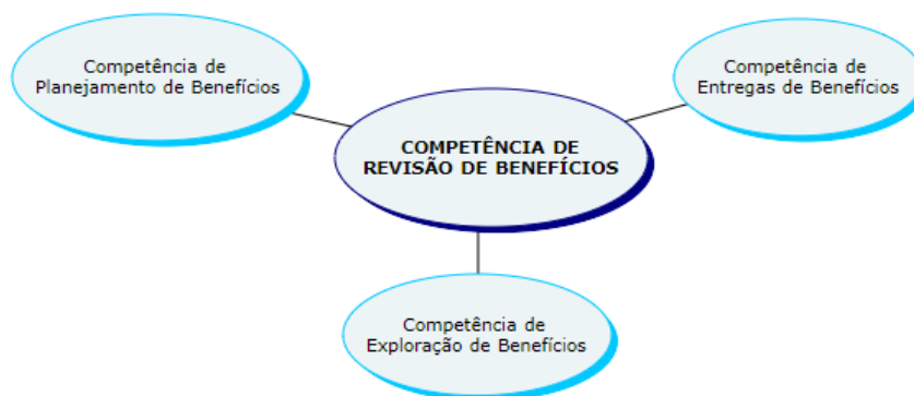
Figura 1. Modelo conceitual de competências para realização de benefícios

Ainda com base no modelo dos autores, três competências se ligam a competência de revisão de benefícios, sendo: a “competência de planejamento de benefícios”, vista como a capacidade de identificar e enumerar os resultados planejados de um projeto de TI, acrescido da identificação dos meios pelos quais se alcançou; a “competência de entrega de benefícios”, sendo a capacidade de projetar e executar programas de mudança organizacional estabelecidos no plano de realização de benefícios; e, como terceiro ponto, a competência de “exploração de benefícios” tida como a adoção de um portfólio das práticas necessárias para que seja possível perceber os benefícios decorrentes dos aplicativos e serviços de TI (Ashurst et. al. , 2008). O modelo detalhado é sintetizado na figura 1.